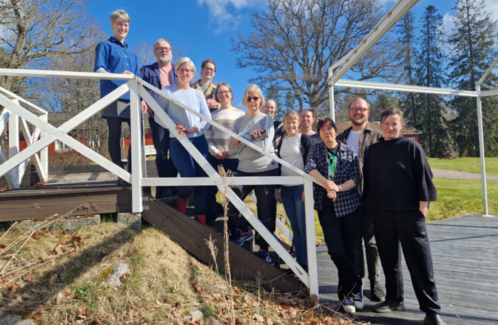
CRS-medarbetare på arbetsinternat i april 2024.