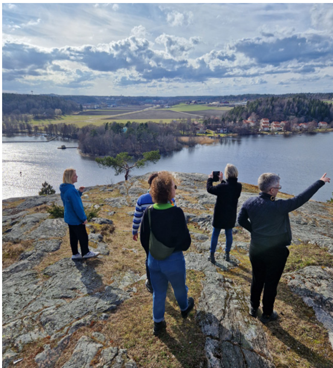
Representanter från WATCH på studiebesök i Tullinge i maj 2024.