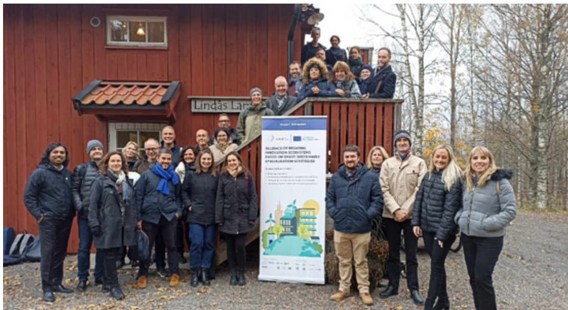
Representanter från det internationella projektet ARIES4 möttes i Karlstad i oktober 2023.