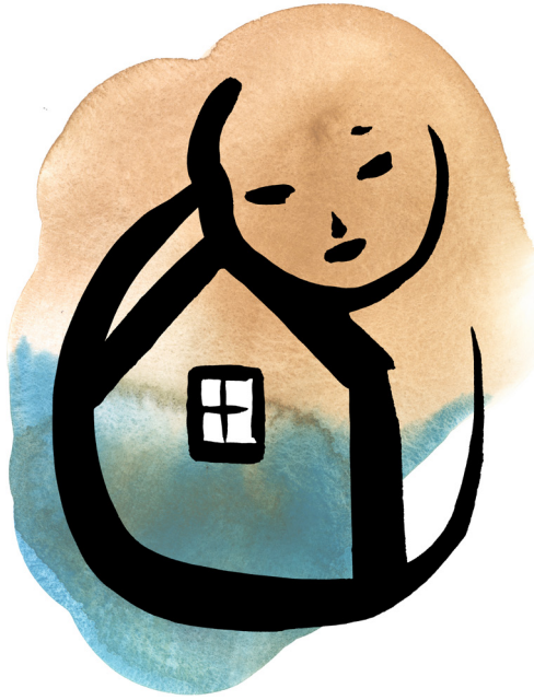
Illustration: Sina Wisén/Sönderberg Agentur