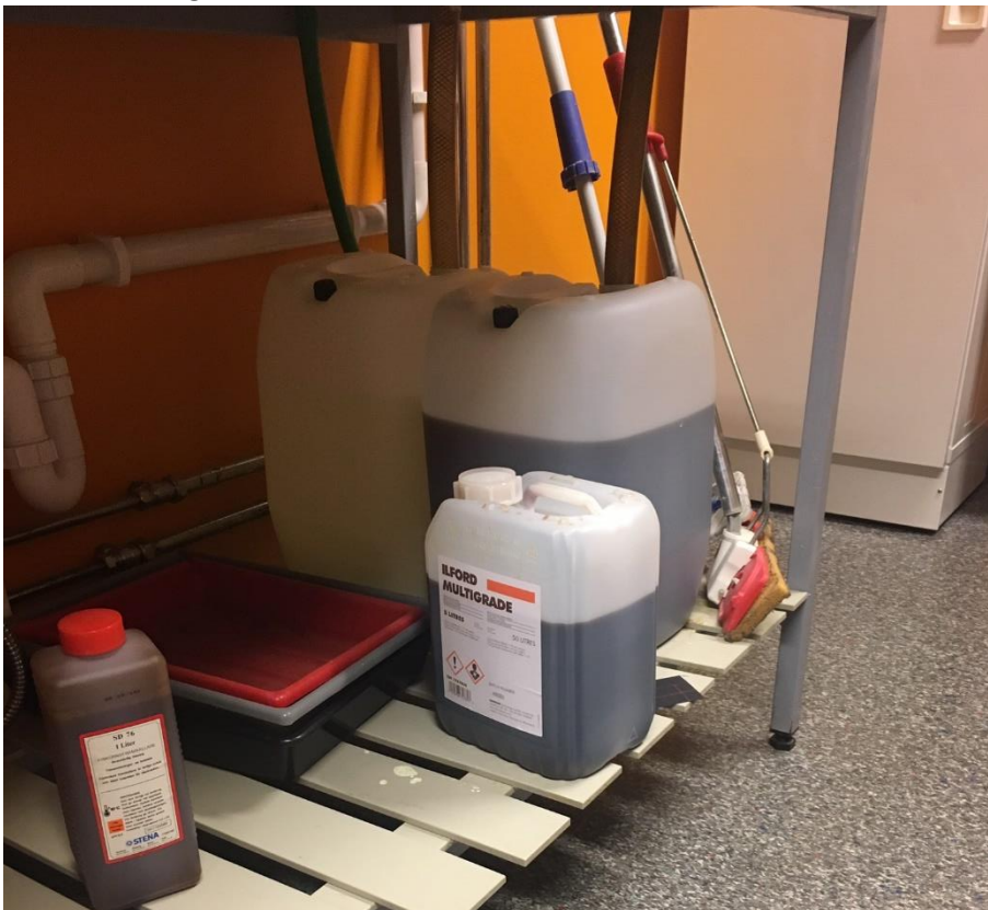
Figur 2. Behållare innehållande kemikalier som innebär fara för hälsa och miljö förvarades utan invallning i fotolabb.