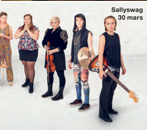
Sallyswag 30 mars