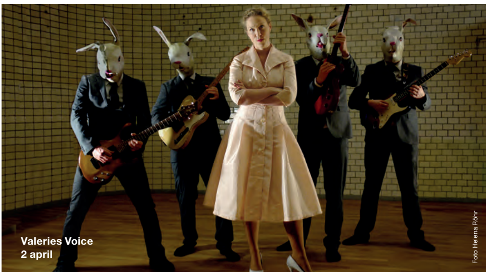
Valeries Voice 2 april