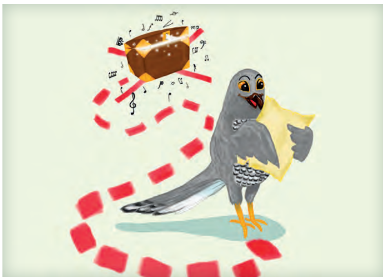
Illustration Viktoria Brå