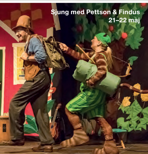
Sjung med Pettson & Findus 21-22 maj